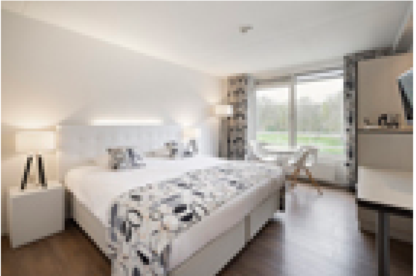
Hotel Mitland **** (Utrecht)

Bei der Auswahl der Unterkunft versuchen wir so weit wie möglich einen sicheren und geschlossenen Fahrradschuppen zu berücksichtigen. Allerdings können wir dies nicht bei allen Unterkünften garantieren und dies hängt teilweise von der Anzahl der Fahrräder anderer Gäste ab.