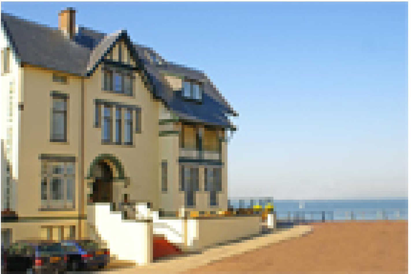
Boulevard Hotel *** (Scheveningen)