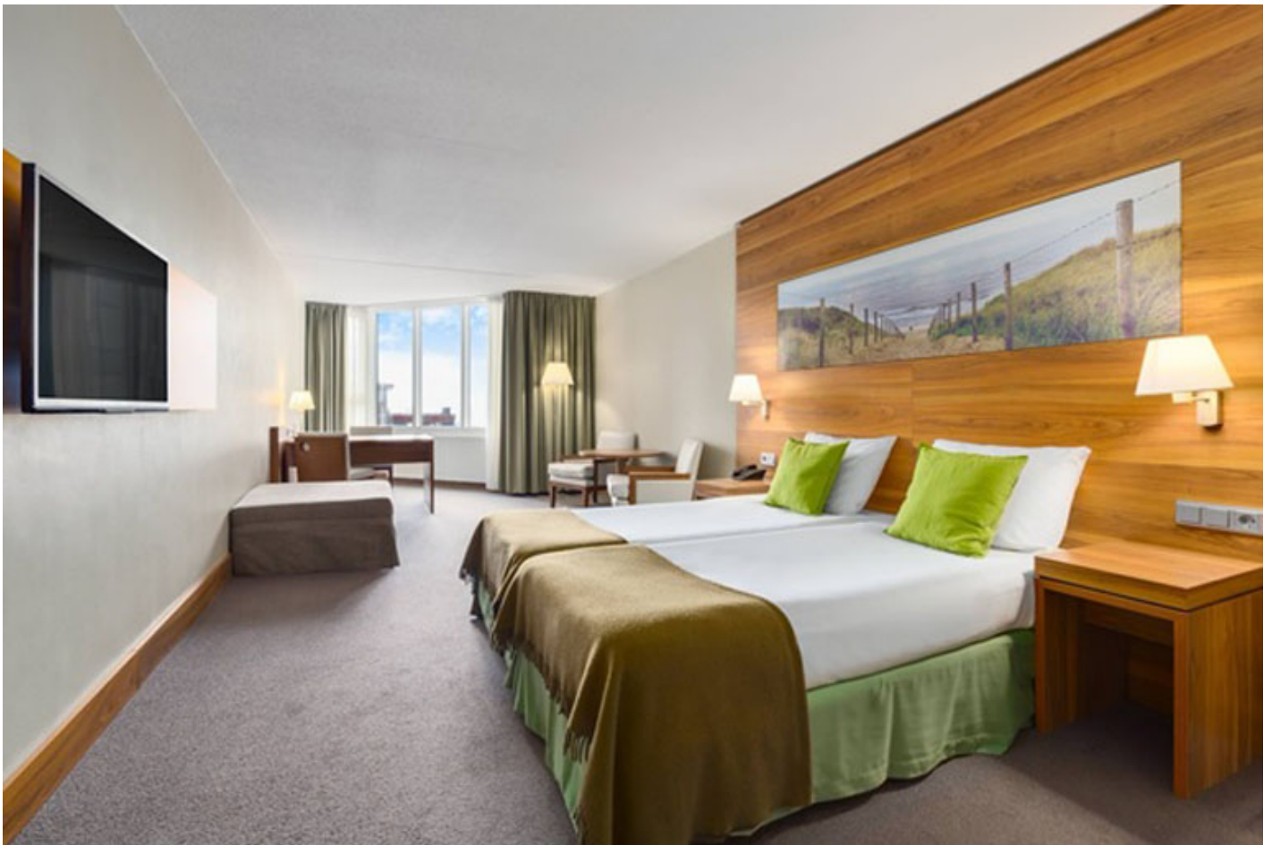
NH Hotel Zandvoort ***** (Zandvoort)