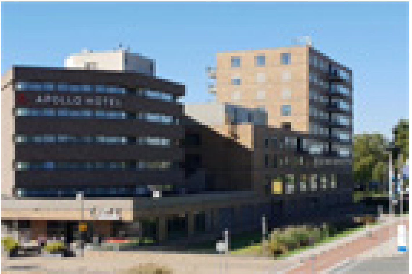
Leonardo Hotel Papendrecht **** (Papendrecht)