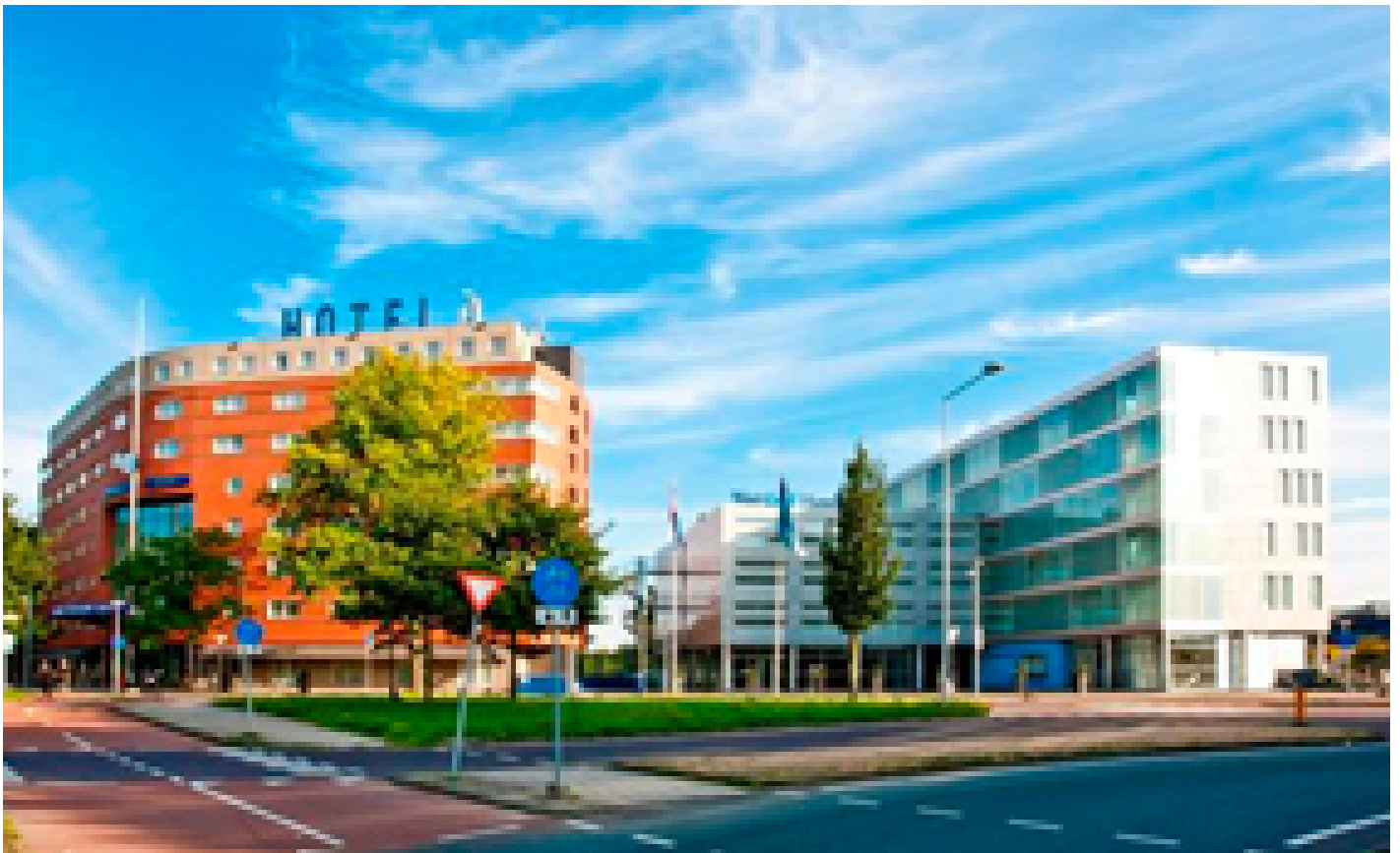
Westcord Art Hotel ***/**** (Amsterdam)