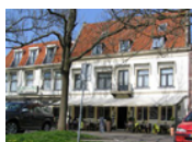
Hotel Restaurant Die Port van Cleve *** (Enkhuizen) www.deportvancleve.nl