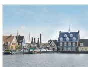
Fletcher Hotel Nautisch Kwartier **** (Huizen) www.hotelnautischkwartier.nl