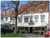
Hotel Restaurant Die Port van Cleve *** (Enkhuizen) www.deportvancleve.nl